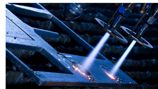
Procesare table groase