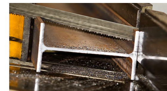
Procesare profile, țevi și bare