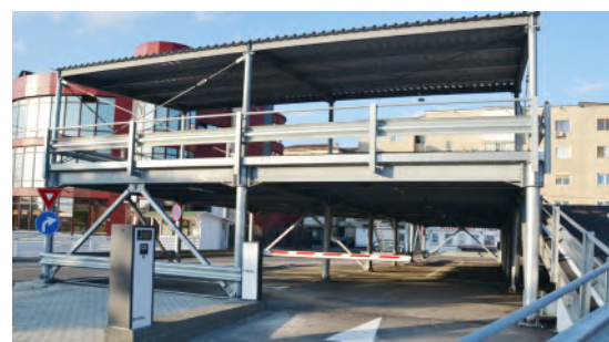
Sisteme de parcare