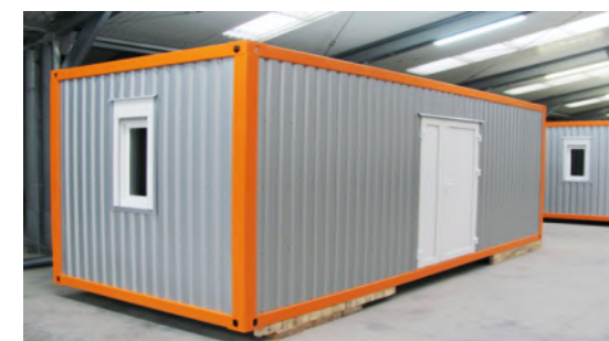
Containere de oțel