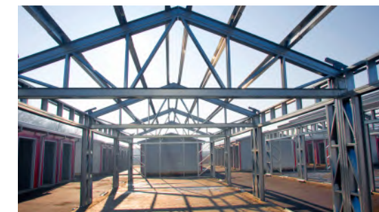
Structuri ușoare din oțel